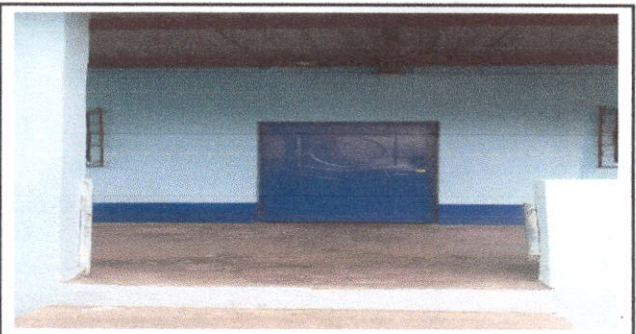
FOTO 6: SUSTITUCIÓN DE VENTANAS DE MADERA POR METAL MÁS VIDRIO Y PINTURA EN MUROS EXTERIORES E INTERIORES

Observación: Si es necesario se pueden agregar hojas adicionales y actualizar el número de hojas.